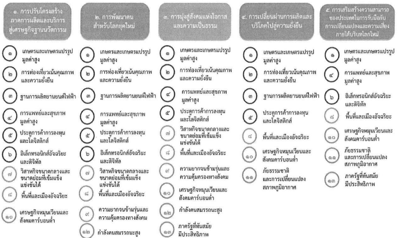
แผนภาพที่ ๓.๑ ความเชื่อมโยงระหว่างหมวดหมู่การพัฒนา กับเป้าหมายหลัก

ความเชื่อมโยงระหว่างหมวดหมู่การพัฒนา กับเป้าหมายหลักแสดงไว้ในแผนภาพที่ ๓.๑ โดยหมวดหมู่ การพัฒนาที่กำหนดขึ้นเป็นประเด็นที่มีลักษณะเชิงบูรณาการที่ครอบคลุมการพัฒนาตั้งแต่ในระดับต้นน้ำจนถึง ปลายน้ำ และสามารถนำไปสู่ผลพัฒนาทั้งในมิติเศรษฐกิจ สังคม ทรัพยากรธรรมชาติและสิ่งแวดล้อมไปพร้อมๆ กัน ทำให้หมวดหมู่แต่ละประการสามารถสนับสนุนเป้าหมายหลักได้มากกว่าหนึ่งข้อ นอกจากนี้การพัฒนาภายใต้ แต่ละหมวดหมู่ไม่ได้แยกขาดจากกัน แต่มีการสนับสนุนหรือเอื้อประโยชน์ซึ่งกันและกัน